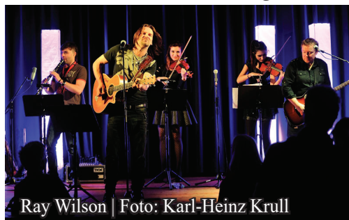
Ray Wilson

einmaliger Stimme getragen, welcher allein mit dem letzten GENESIS-Album „Calling All Stations“ das drittbestverkaufte der Bandgeschichte eingesungen hat. Ray Wilson, der vom „Classic Rock Magazin“ als einer der erstklassigen Sänger Großbritanniens ausgezeichnet wurde, ist bekannt für seine starke Bühnenpräsenz und begeisternden Auftritte. Auch in Blomberg sorgte er für große Wellen der Begeisterung und riss das Publikum förmlich von den Stühlen. Begleitet wurde er von einem Quintett, bei dem jeder einzelne Musiker zu überzeugen wusste.