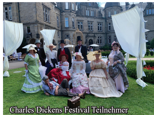
Charles Dickens Festival Teilnehmer

Das Charles Dickens Wochenende in Blombergs historischer Altstadt wird von der „Kulturwerkstatt Blomberger Land“ organisiert. Das ist ein gemeinnütziger Verein, der sich zur Aufgabe gemacht hat, in Blomberg und der näheren Umgebung kulturelle Veranstaltungen durchzuführen. Das größte Projekt des Vereins ist das „Charles Dickens Event“, das jedes Jahr an dem Wochenende des dritten Advents in der Altstadt von Blomberg stattfindet und immer tausende Besucher in die Zeit des 19. Jahrhunderts zurückversetzt. Zahlreiche kostümierte Darsteller verzaubern die Besucher, die sich auch selbst Kostüme für diese Tage leihen können.