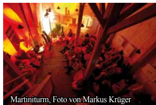
Martiniturm, Foto von Markus Krüger

Die Nächte der Poesie im Blomberger Martiniturm sind inzwischen eine feste kulturelle Größe