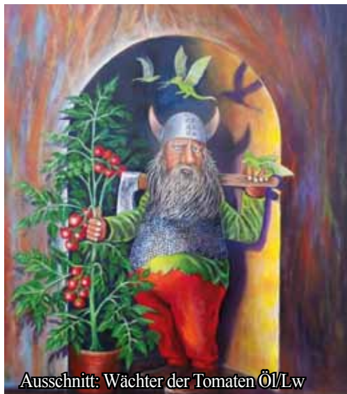
Ausschnitt: Wächter der Tomaten Öl/Lw

Der Blomberger Kunstmaler Wolfgang Rose stellt ab dem 30. August 20 Werke unter dem Motto „Von Natur bis Fantasie“ im Blomberger Martiniturm aus. Die faszinierenden Gemälde sind in Öl auf Leinwand gemalt, und der besondere Ausstellungsort gibt dem Besuch der Ausstellung einen zusätzlichen Reiz.