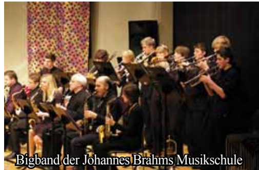
Bigband der Johannes Brahms Musikschule