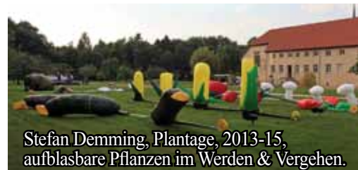
Stefan Demming, Plantage, 2013-15, aufblasbare Pflanzen im Werden & Vergehen.

Darüber hinaus wird auch Einiges zu sehen sein: