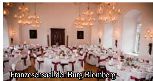
Franzosensaal der Burg Blomberg

Genießen Sie den Pfingst-Brunch mit Jazz-Musik live in dem einmaligen Ambiente des Franzosensaals der Burg Blomberg!