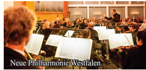
Neue Philharmonie Westfalen

Das Weihnachtskonzert der AG Kultur von Blomberg Marketing e.V. ist fraglos eines der Highlights in der Vorweihnachtszeit. Details zum Programm werden ab September 2019 bekannt gegeben, dann startet auch der Vorverkauf!