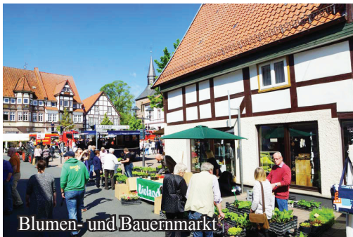
Blumen- und Bauernmarkt

In entspannter Atmosphäre können die Besucher durch die Innenstadt schlendern und die Gelegenheit auch für ein Sonntags-Shopping nutzen. Die Blomberger Einzelhändler öffnen ihre Türen von 13 bis 18 Uhr. Weitere Aktionen runden das Programm ab.