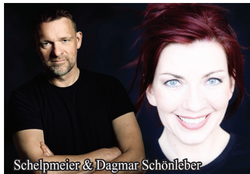
Schelpmeier & Dagmar Schönleber

Wersichalsgebürtige Ostwestfälin im Rheinland zuhause fühlt, ohne die eigenen Wurzeln zu verlieren, hat ein Talent für Integration. Das zeigt sich auch in allen Programmen der preisgekrönten Kabarettistin, Liedermacherin und Autorin Dagmar Schönleber.