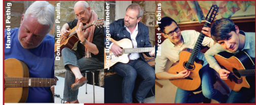
Kulturhaus „Alte Meierei“, Blomberg Sonntag, 22. Sept. 2019 11:00 Uhr

Verein die Feierlichkeiten mit einer Matinee ab 11 Uhr - Lokalmatadore treffen internationale Freunde!